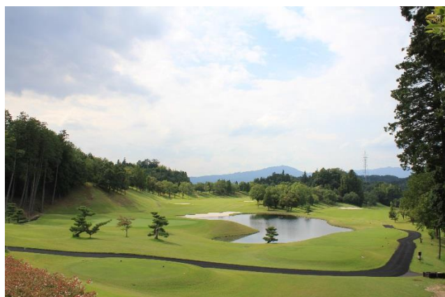
中京ゴルフ倶楽部 コース風景