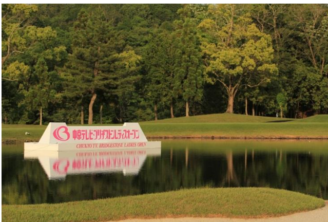
中京ゴルフ倶楽部 石野コース

今年の大会は「上田桃子」選手が実に三年ぶりとなる、ツアー優勝を飾り、みなさまの記憶にも新しい名門コースではないでしょうか。