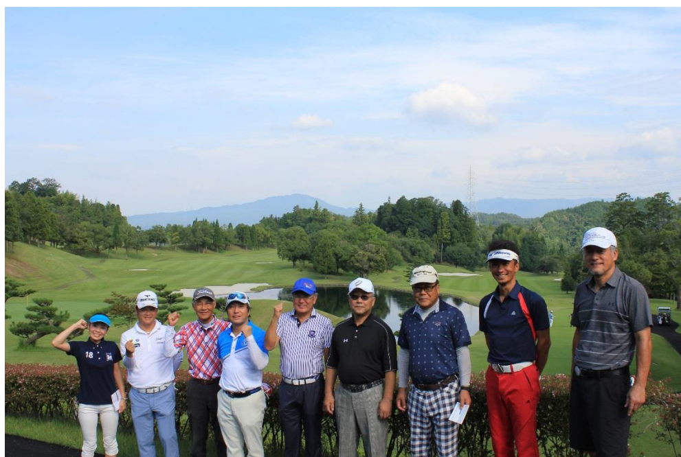
茨城ゴルフ倶楽部コンペ 集合写真

当日コンペに参加頂いた皆さんは、 中京ゴルフ倶楽部 石野コースは初めての方ばかりで、 クラブハウスから出て、すぐ目の前にある美しい9番ホールを見て 皆さん感心しているご様子でした。